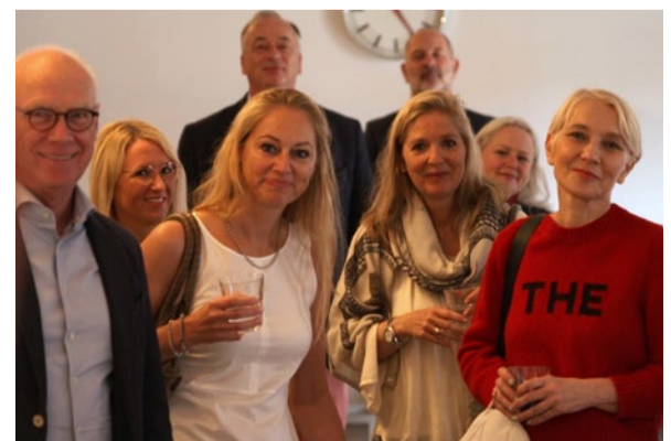
Abb. 2 bis 3: Impressionen der beiden „Club of Ambassadors“-Treffen